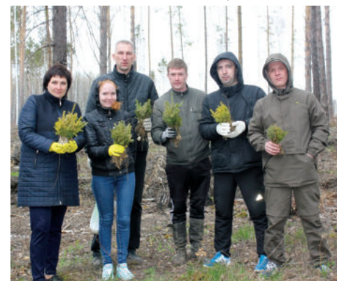
Редакция приносит свои извинения.

В материале «Эколог, активистка, спортсменка, актриса – и это все о ней», опубликованном в газете «Родники ирбитские» № 24 от 30 апреля на 7-й полосе, ошибочно была использована фотография иного коллектива. Смотреть следует так: