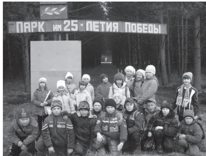
Учащиеся Килачевской школы на субботнике в «Парке Победы».

Олег Молокотин ФОТО С САЙТА КИЛАЧЕВСКОЙ ШКОЛЫ